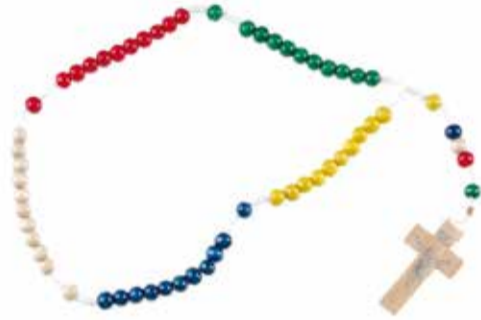
Το πράσινο για την Αφρική, το κόκκινο για την Αμερική το λευκό για τη Ευρώπη, το μπλε για την Ωκεανία και το κίτρινο για την Ασία.

Σημείο συνάντησης η διασταύρωση Δανακού - Κινίου (θέση Κουντουριδιά).