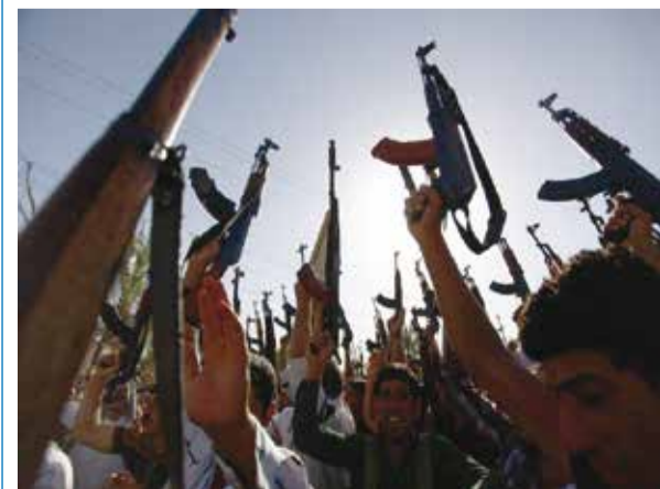
στη σελ. 2 στήλη 1

Ειδικότητά μας είναι να δογματίζουμε, όπως ο πάπας, στις εφημερίδες. Είναι αναπόφευκτο, αλλά όχι λιγότερο ανυπόφορο, ότι μετά από τραγωδίες όπως αυτή στο Παρίσι, να σηκώνεται ένα σύννεφο εύκολα, όχι απλά από γνώμες αλλά και πεποιθήσεις που, συνήθως, προορίζονται μετά από μερικές ημέρες, αν όχι ώρες, να δια-